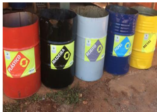
Figura 1: Baias para plástico e papel e coletores para segregação de resíduos. Fonte: Dados da pesquisa, 2019.

Para um melhor controle foi utilizado o formulário de Comprovante de Transporte de Resíduos (CTR) onde é possível identificar o gerador, transportador, receptor e o tipo de resíduo retirado da obra. Estas CTRs são apresentadas ao órgão público responsável a fim